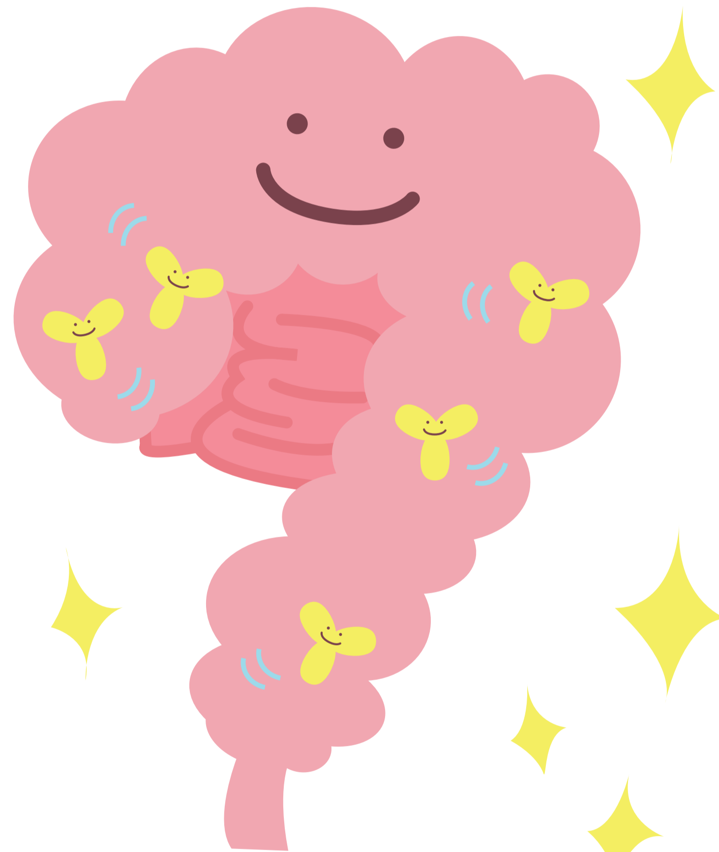
〈図〉 殺菌乳酸菌 EC-12 摂取 4 週間後の腸内細菌叢

殺菌乳酸菌 EC-12 の経口摂取が、腸内環境叢と腸内有機酸濃度を改善することが、ヒト介入試験の結果から示されました